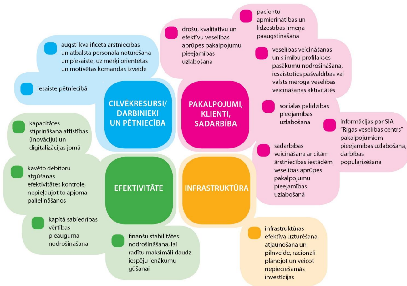
Attēls Nr.3: SIA "Rīgas veselības centrs" stratēģiskie attīstības virzieni un mērķi – mērķu karte (2022.-2024. gads)