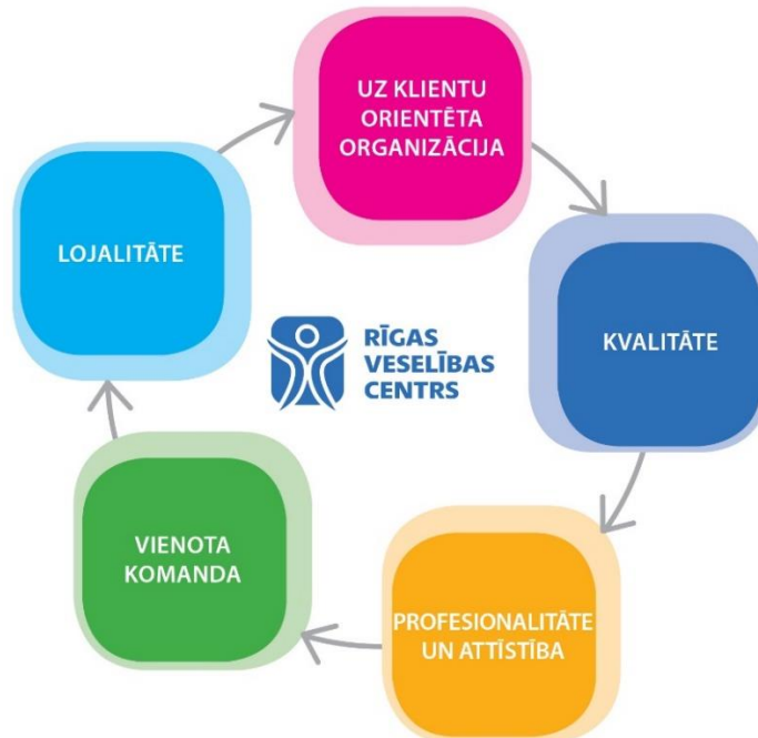
Attēls Nr.2: SIA “Rīgas veselības centrs” vērtības

Vērtības vieno SIA “Rīgas veselības centrs” stratēģijas mērķu sasniegšanā (skatīt attēlu Nr.2).